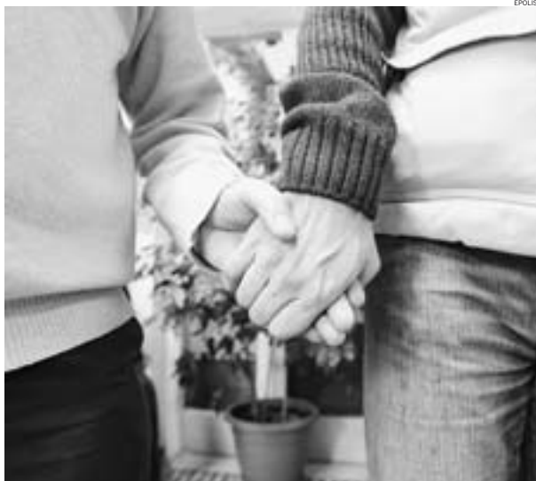
► Il consiglio comunale boccia la discussione sulle unioni di fatto a Ca' Farsetti

NONOSTANTE TUTTO i radicali in città appaiono ottimisti. E proprio ieri si sono riuniti all'hotel Ambasciatori per un incontro pubblico sui Pacs, a cui ha preso parte anche l'onorevole Daniele Capezzone, esponente radicale della Rosa nel Pugno. La speranza del coordinamento veneziano di Rnp è che anche Venezia segua la strada della mozione approvata a Padova, dove la misura della "famiglia anagrafica per legami affettivi" è una realtà ormai.