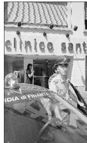
L'ingresso della clinica S. Rita