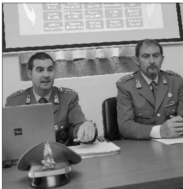
I vertici della Guardia di Finanza illustrano la maxifrode da 90 milioni

La montagna di carte false, sequestrata dagli inquirenti in 180 perquisizioni, sarebbe servita a due scopi: eludere le tasse e certificare che il ferro commercializzato fosse perfet-