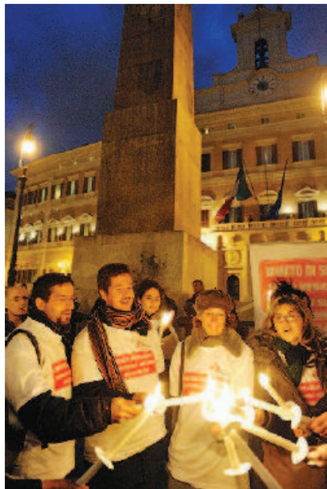
Una manifestazione di medici contro il decreto

do alle disposizioni in materia di iscrizione all'anagrafe dei figli di immigrati clandestini e in materia di segnalazione di immigrati clandestini da parte delle strutture sanitarie pubbliche». Dice Giuseppe Cascini, segretario dell'Anm: «Immaginate tutte le prostitute nigeriane che non potranno più andare in ospedale per paura di essere denunciate e che non potranno più iscrivere i propri figli all'anagrafe. Il risultato potrebbe essere quello di moltiplicare gli aborti clandestini tra le irregolari». Osservazioni vengono anche da Piero Grasso, il procuratore nazionale antimafia: «Il nuovo disegno di legge in materia di sicurezza, così come è stato riproposto, azzerava le funzioni di impulso e coordinamento che erano state date alla procura nazionale antimafia nel precedente decreto sulle misure di prevenzione».